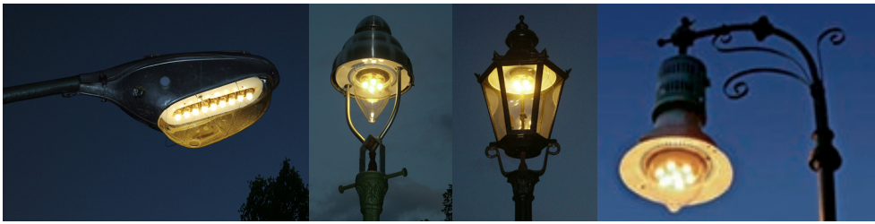
Reihenleuchte oder Peitschenleuchte, 1950