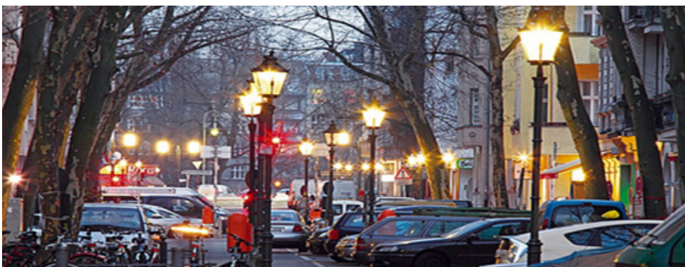
Schinkel Laternen, Danckelmannstraße Charlottenburg, Foto R. Rossner